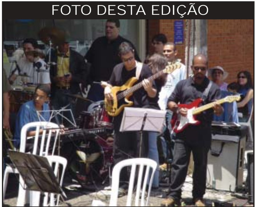
“Equipe de Louvor toca em praça pública na cidade de Guarapuava - PR”